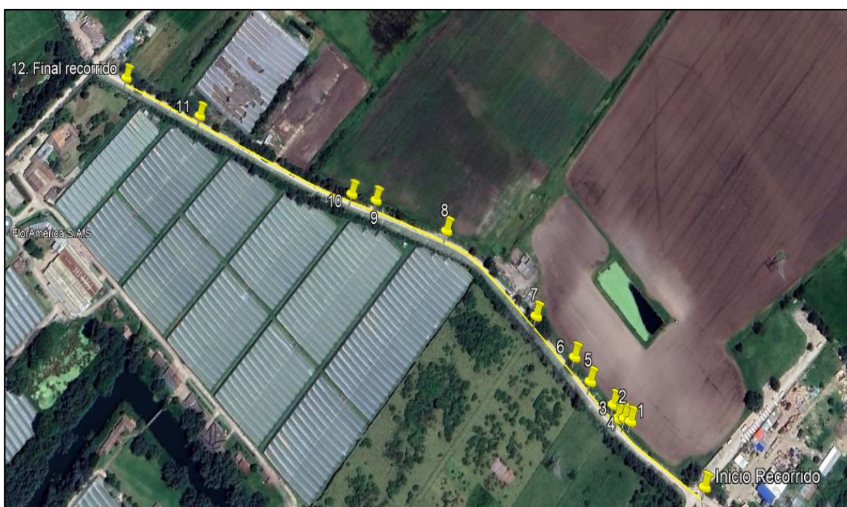
Ilustración 1. Recorrido verificación ambiental -Vereda 7 Trojes

Se realizó recorrido de control y vigilancia de los componentes ambientales en áreas rurales del municipio de Funza, vereda Siete Trojes, el día 10 de abril de 2024, desde las coordenadas 4°43'59.41"N - 74°13'34.43"W hasta las coordenadas 4°44'12.44"N - 74°13'55.55"W (ver ilustración 1. Ruta amarilla), con el fin de verificar las condiciones ambientales, identificar posibles afectaciones a los recursos naturales y realizar las acciones de prevención correspondientes.